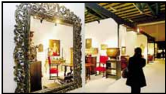
«Bergamo Antiquaria» alla Fiera di via Lunga

Il Gruppo mercanti d'arte antica di Bergamo, spinto dal favorevole riscontro dello scorso anno, propone all'interno dell'edizione 2008 di Bergamo Antiquaria la 2ª edizione del convegno «Segreti svelati. Curiosità, segreti e leggende nel mondo dell'antiquariato». L'appuntamento è per giovedì alle 18 nella sala Caravaggio della Fiera di Bergamo all'interno della mostra d'antiquariato che per l'occasione prolungherà l'orario di apertura fino alle 22.